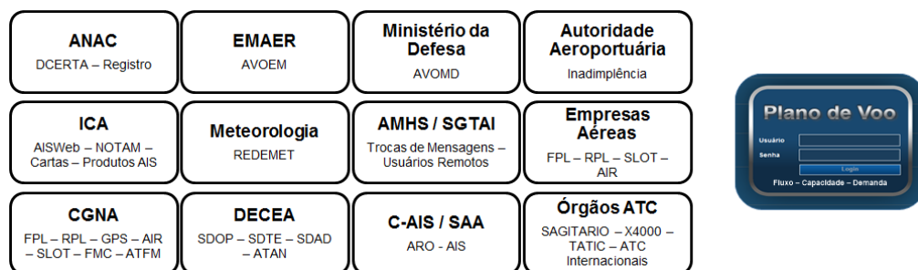
Figura 1. Necessidades de interoperabilidade entre bancos de dados

2.1.8 Outra atividade do processo de entrega, recebimento, análise e encaminhamento das intenções de voo ocorre durante o seu preenchimento, pois esse processo poderá sofrer interações com outros setores, tais como: